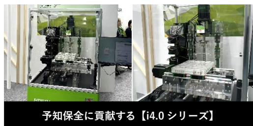
予知保全に貢献する【i4.0シリーズ】

高速ロータリーテーブルや放電加工機向け水中用 DD ロータリーテーブル、予知保全に貢献する i4.0 シリーズなど、工作機械の進化をサポートする製品をご紹介します。当社のロータリーテーブルはゼロバックラッシュ・DD方式で豊富なライン