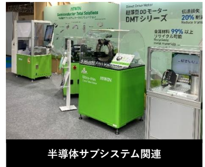
半導体サブシステム関連