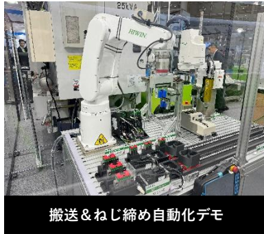
搬送&ねじ締め自動化デモ